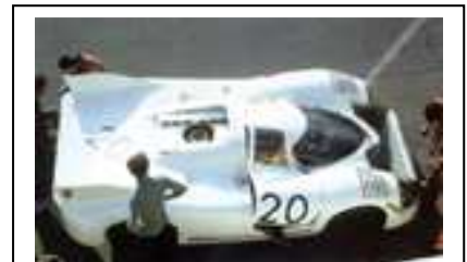
1971 Le Mans Trials