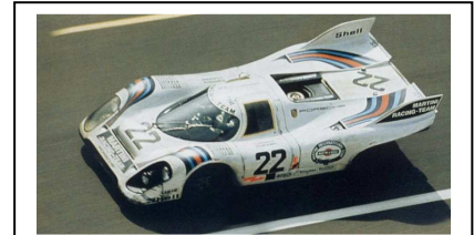
1971 Le Mans