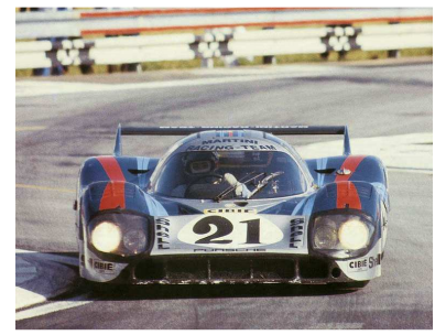
1971 Le Mans # 042