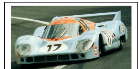
1971 Le Mans