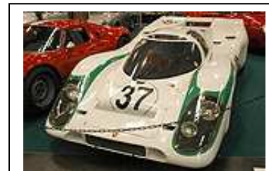
2004 - ?