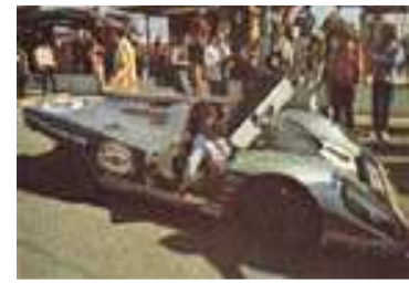
1971 Daytona # 023