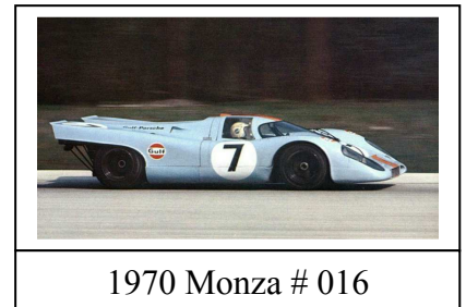
1970 Monza # 016