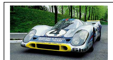
1998 – ca. 2006