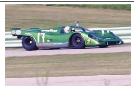
1984 Chicago Historics