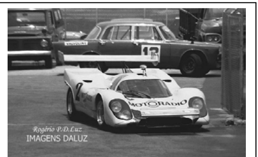
1972 Coppa Brasil