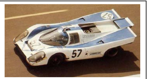
1971 Le Mans