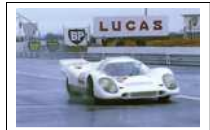
1970 Le Mans Trials LH u K