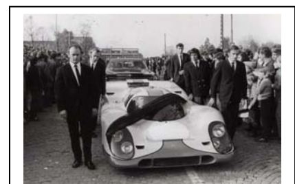
29.10.71 Beerdigung Jo Siffert