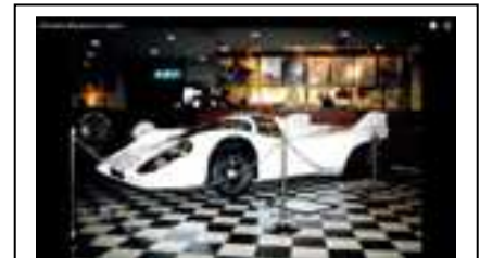
1995 Matsuda Museum (J)