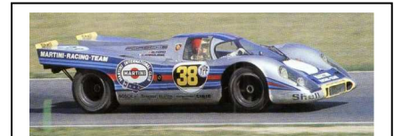
1971 Buenos Aires