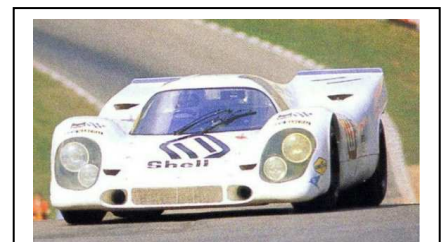
1970 Brands Hatch