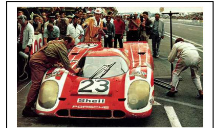
1970 Le Mans