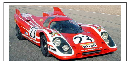
2000 Symbolic Motors