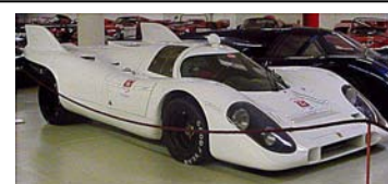
1993 Rosso-Bianco Museum