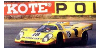
1970 Le Mans