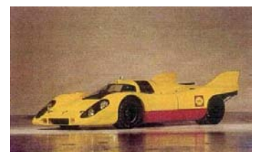
1991 Rosso-Bianco Museum