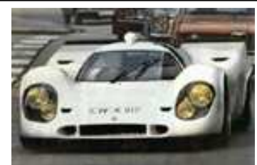
1977 - ??