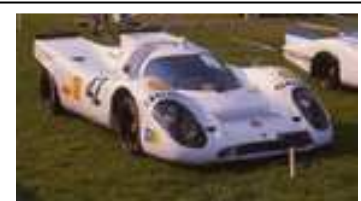
1995 Historic Event