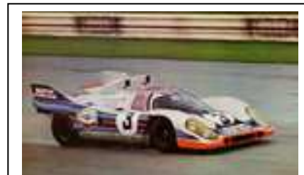
1971 Monza Training