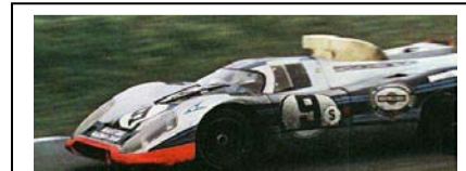
1971 Brands Hatch