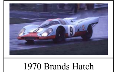
1970 Brands Hatch