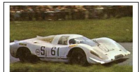
1969 Nürburgring als # 004