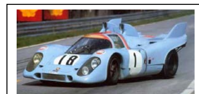
1970 Le Mans Trials