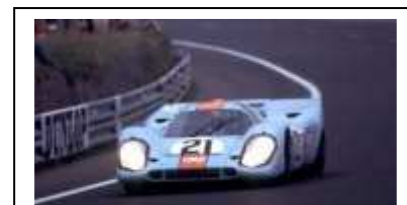
1970 Le Mans