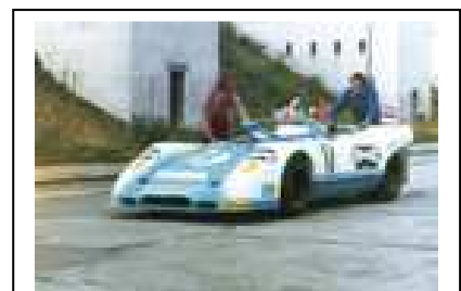
1971 – 2000 als # 01 - 021