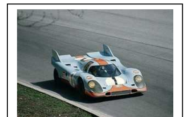
1971 Monza #004-017