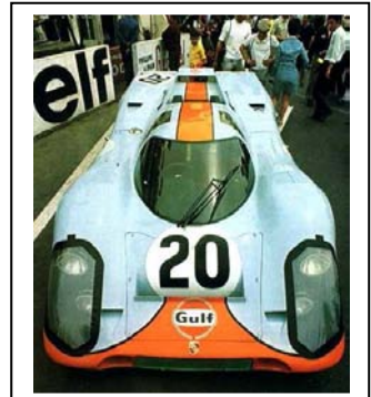
1970 Le Mans