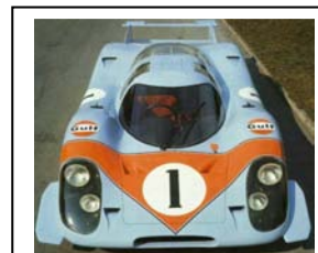
09/1969 Präsentation GULF-Racing