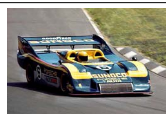
1973 Watkins Glen