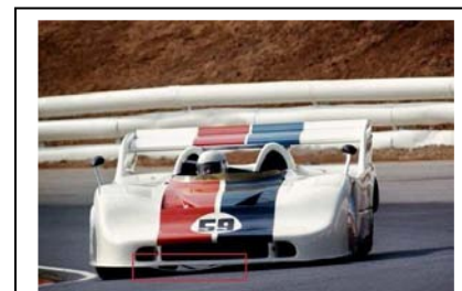
1972 CanAm Riverside