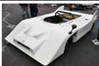
2013 Le Castellet