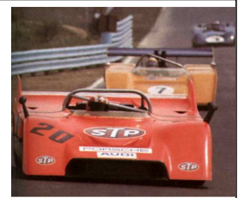
1971 Watkins Glen Rennen