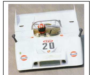
1971 Watkins Glen Training